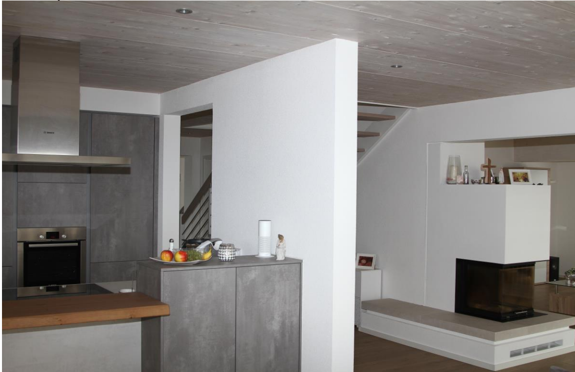
Bild: Beispiel für Massivholzdecke mit UV-Schutz endbehandelt