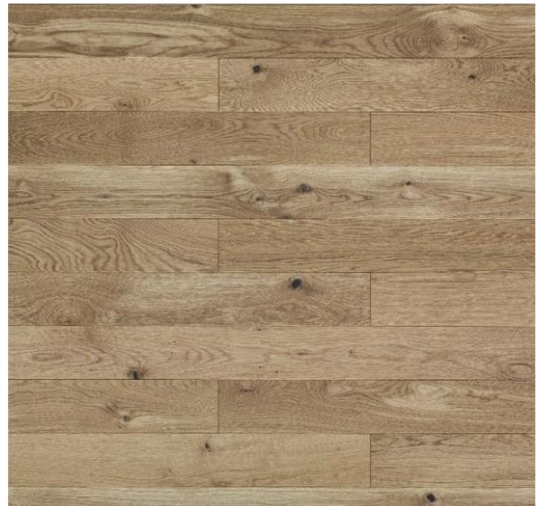
Bild: Beispiel Diele Eicheoptik