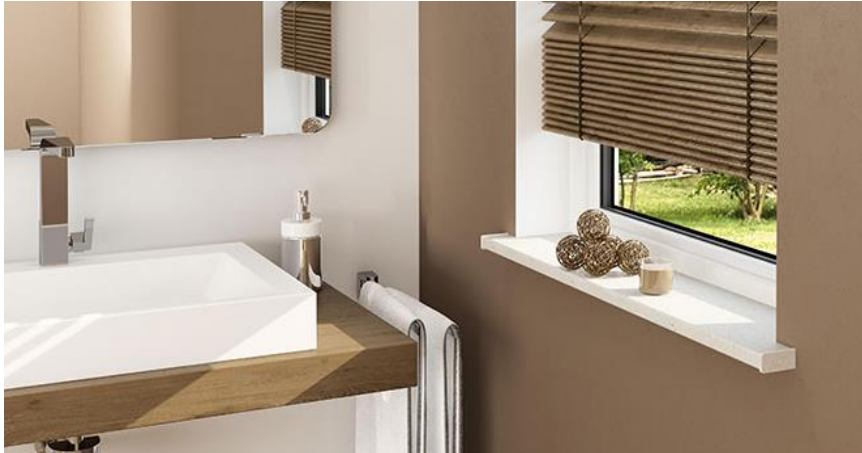
Bild: Fensterbank Getalit, Dekor weiß